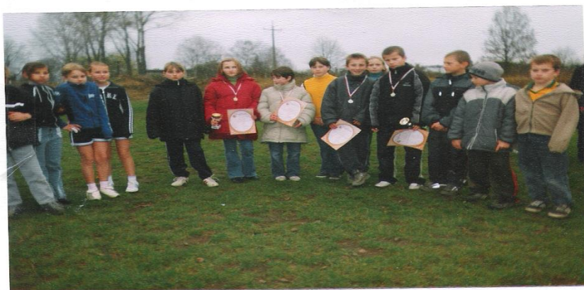
Stagrodzenie najlepszych uczestników ze Szkół Podstaroniej i Dobrymionice.